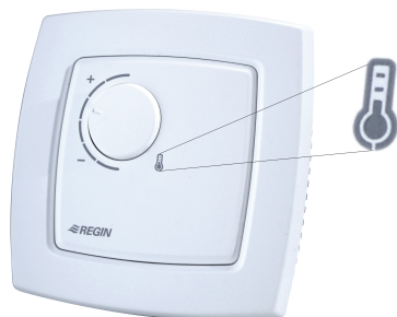
Fig. 1 Température

Le régulateur est doté d'une LED située dans le thermomètre dessiné sur l'avant du régulateur. Une lumière rouge indique que le mode chauffage est actif et une lumière bleue indique que le mode refroidissement est actif. Si la LED est éteinte, aucune régulation n'est active.