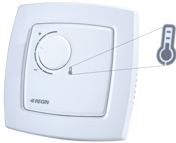
Bild 1 Temperaturanzeige

Der Regler hat eine LED in Form eines Thermometers auf der Frontseite. Die LED leuchtet rot, wenn die Heizregelung, und blau, wenn die Kühlregelung aktiviert ist. Keine LED Anzeige bedeutet, dass weder Heiz- noch Kühlregelung aktiv ist.