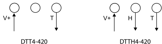
Bild 1 | V+ = 11 + (0,02 \times RL) \dots 30 V DC, H und T = 4...20 mA