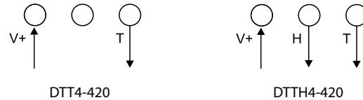
Figur 1 V+ = 11+(0.02xRL)...30 V DC, H och T = 4...20 mA